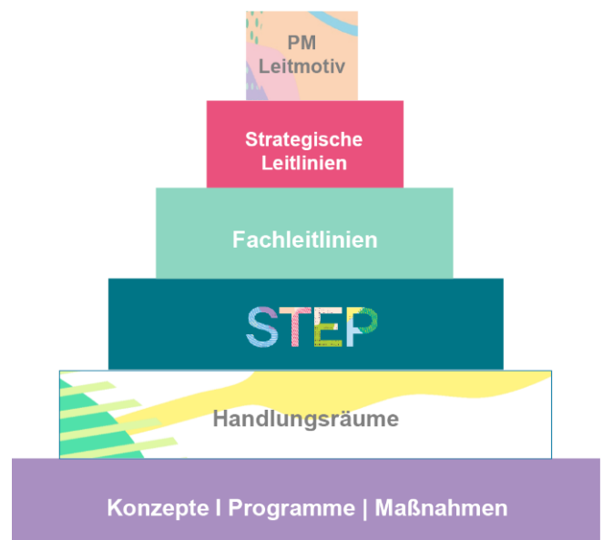
Abbildung: Gesamtsystem der Perspektive München

Mit der Perspektive München 2 verfügt die Landeshauptstadt München über ein integriertes Stadtentwicklungskonzept, das seit der letzten Fortschreibung mit einer neuen Präambel und überarbeiteten Strategischen Leitlinien sowie der Implementierung der 17 SDGs die Funktion als Nachhaltigkeitsstrategie der Landeshauptstadt München übernimmt. Ein zentraler Bestandteil der Perspektive München sind die Fachleitlinien. Sie beinhalten fachbezogene Zielaussagen zu allen relevanten Themenfeldern der Stadtentwicklung und sind wichtige Steuerungsinstrumente stadtweit und in den Referaten. In ihnen werden die übergeordneten Ziele der Strategischen Leitlinien konkretisiert und sie stellen zusammen mit ihren hinterlegten Fachkonzepten und Leitprojekten das operative Handlungsprogramm der Landeshauptstadt München dar. Mit dem Stadtentwicklungsplan (STEP) und den Handlungsräumen der Stadtentwicklung wird die Perspektive München um räumliche Ansätze ergänzt. 3